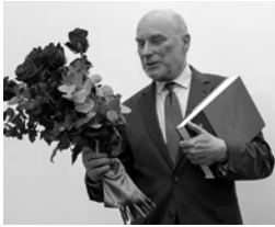
→ see p. 174